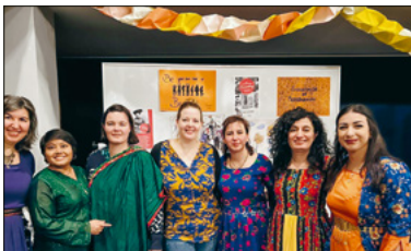
Frauen in ihren verschiedenen Trachten.