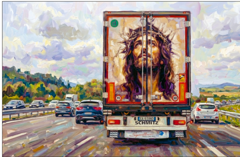
Pfingsten bewegt uns nicht nur auf Strassen, sondern im Leben.

Die Pfingsttage nutzen viele Menschen als willkommene Freizeit und zur Erholung. Das ist gut und tut gut. Pfingsten will beleben und begeistern.