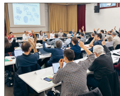
Der Grosse Kirchenrat während einer Sitzung.

Informeller Teil: Vorstellung FB Migration / Integration Abschluss