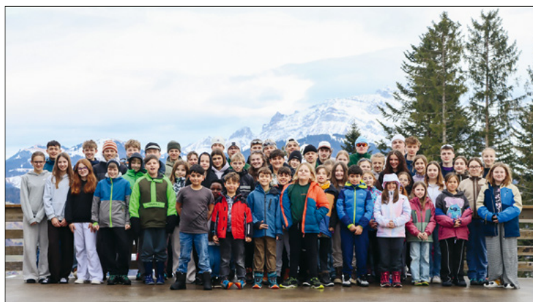
Als kleiner Vorgeschmack: das Scharfoto von unserem Winterlager.

Sommerlager: Hoch über den Wolken liegt der Olymp – Heimat mächtiger Götter und uralter Kräfte. Doch der Herrscherblitz von Zeus ist verschwunden.