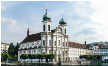
Die barocke Jesuitenkirche.