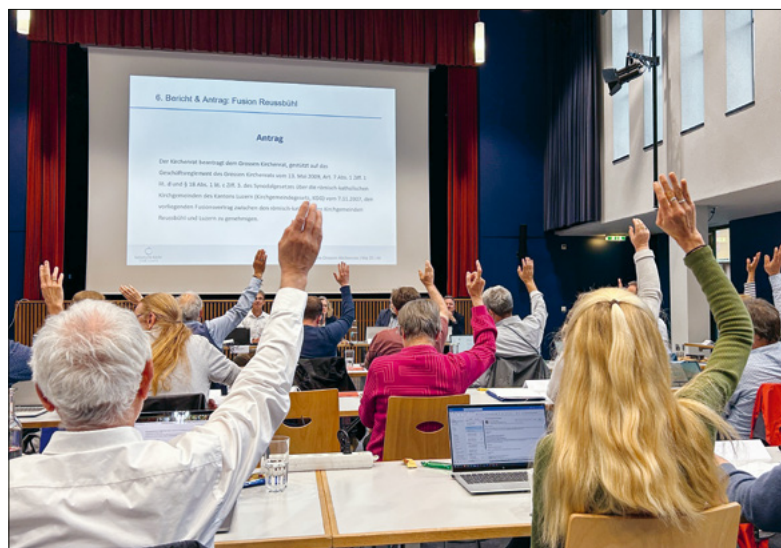
Blick ins Parlament: Abstimmung zur Genehmigung des Fusionsvertrags zwischen den Kirchgemeinden Reussbühl und Luzern.

Sind Sie interessiert, als Mitglied des Grossen Kirchenrats mitzuwirken? Nehmen Sie mit uns bis am 15. Juni Kontakt auf über wahlen.parlament@kathluzern.ch . Telefonische