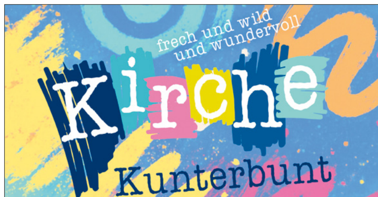
Plakat der Kirche Kunterbunt. Grafik: Evangelisches Jugendwerk Württemberg

Wenn Kirche zum Fest wird. Nach der grossen Familienumfrage kommt Bewegung: «Kirche Kunterbunt» verspricht Erleben statt Kirchenbank-Blues.