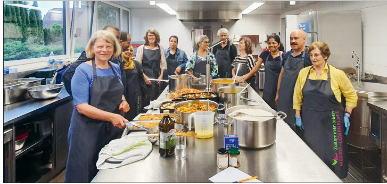
Nicht selten war der Einsatzort die Küche. Catering im Mai 2022.

Nach vielen Jahren im MaiHof geht Silke Busch in Pension. An der GV des ZML am 8. Mai wird sie verabschiedet – Anlass für Fragen zu ihrem Wirken.