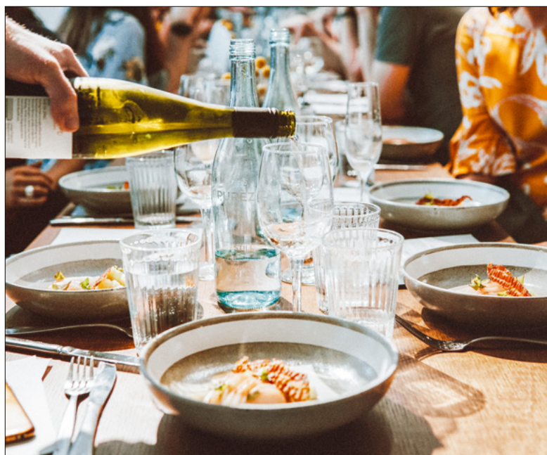
Ein Tag voller Genuss.

Mit einer 30 Meter (!) langen Tafel wird das Quartier am Hof am Samstag, 13. Juni, zum lebendigen kulinarischen und kulturellen Treffpunkt.