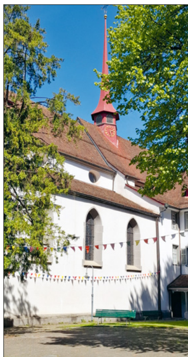
Auch die Franziskanerkirche strahlt Verbundenheit aus.

Zum Tag der Nachbarschaft machen wir die Verbundenheit und Vielfalt unserer Nachbarschaft symbolisch sichtbar mit einer bunten Aktion im Quartier.