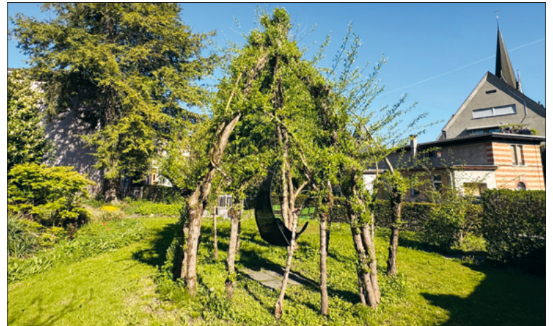
In der Natur die Seele baumeln lassen.

«Schlendrian trotz(t) Leistungsgesellschaft» ist das Thema des letzten Abends der Veranstaltungsreihe «Willkommen in meiner Bubble». Die Bubble-Veranstaltungen sind ein Versuch, vermeintliche Widersprüchlichkeiten zusammenzubringen. Dieses Mal: Langsamkeit und Zweckfreiheit inmitten eines geschäftigen Stadtquartiers in einer leistungsorientierten Gesellschaft. Eingebettet in zwei Naturgärten erleben die Besuchenden Entschleunigung mit allen Sinnen: Gehend, riechend, essend und beobachtend entdecken sie, was sonst unbeachtet und selbstverständlich nebenherläuft. Inspiriert ist die Idee sowohl vom schwedischen Fernsehen, das ganze zwei Wochen lang live Naturaufnahmen zeigt ( svtplay.se/den-stora-algvandringen ) als