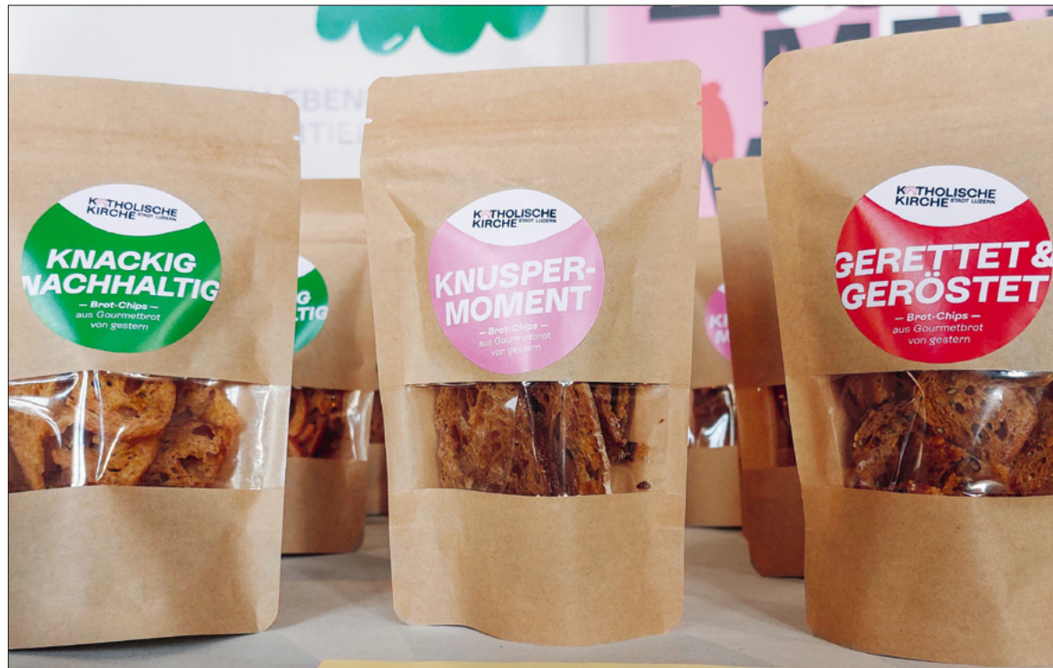
Brot von gestern – eine würzige Leckerei für morgen.