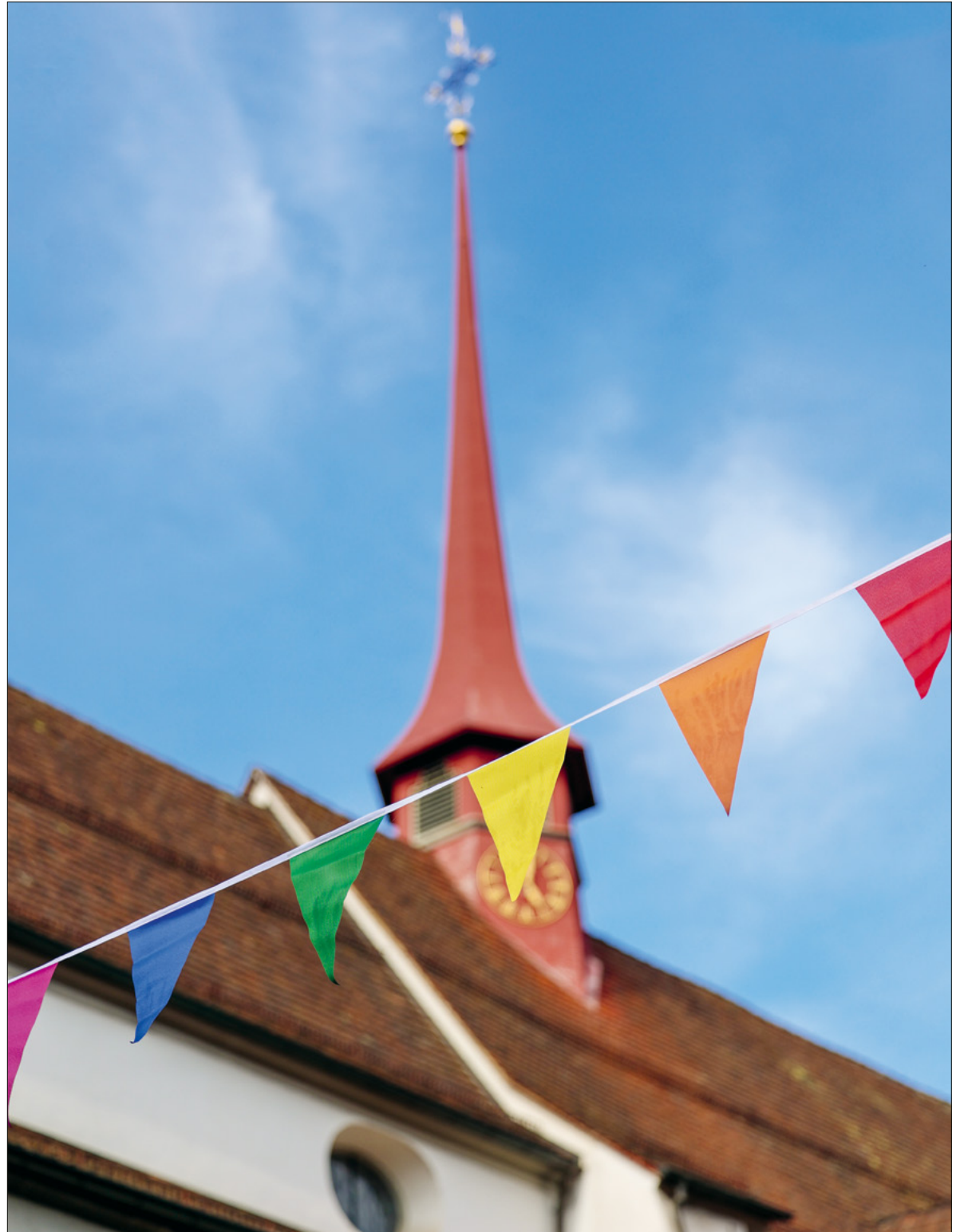
Die Wimpelketten zieren auch die Franziskanerkirche in Luzern.

Am 18. Oktober finden die Gesamterneuerungswahlen für Kirchenrat und Grossen Kirchenrat statt. Die Legislatur dauert von 1. Januar 2027 bis 30. Mai 2030. Kandidatinnen und Kandidaten werden gesucht. Seite 3