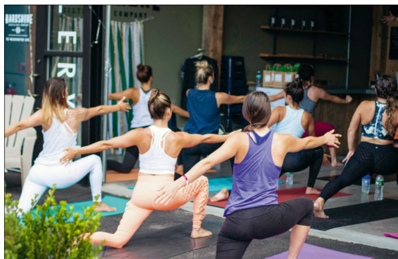
Trotz knappem Budget einen Sportkurs besuchen können.

Der Zugang zur KulturLegi soll möglichst niederschwellig sein, sagt Christian Vogt, Leiter Soziale Integration bei der Caritas Zentralschweiz. Armutsbetroffene Menschen müssen auf vieles verzichten – von aus-