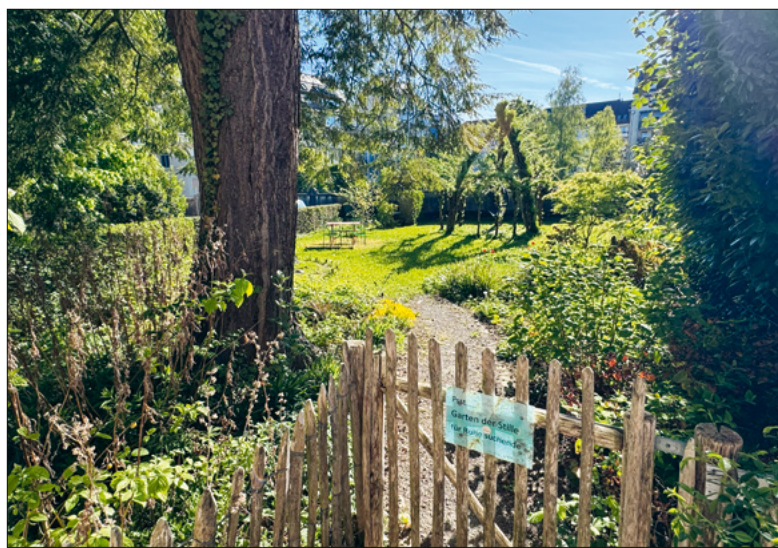
Garten beim Rhynauerhof.

Am letzten Anlass der aktuellen Bubble-Reihe nehmen wir den Fuss vom Pedal: ein garantiert stressfreier Abend der Langsamkeit und zweckfreien Betrachtung.