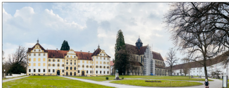
Kloster und Schloss Salem.

«Wege entstehen dadurch, dass wir sie gehen.» (Hans Kudsus) Unterwegs zu Fuss, per Car oder Schiff – immer in bester Gesellschaft auf Entdeckungsreise.