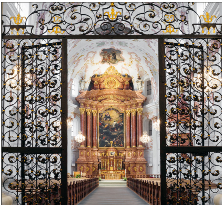
Blick in das Hauptschiff der Jesuitenkirche.

9.00 Keine Predigt Keine Kollekte 17.15 Kein Gottesdienst