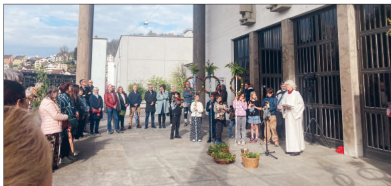
Palmsonntag in St. Karl.