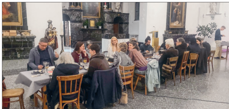
Erstes «Meet & Eat»: betagt-jung. Foto: Peterskapelle

Bei den «Meet & Eat»-Abenden in der Fastenzeit treffen Menschen mit unterschiedlichen Erfahrungen aufeinander. Begegnungen, die Vorurteile leiser machen.