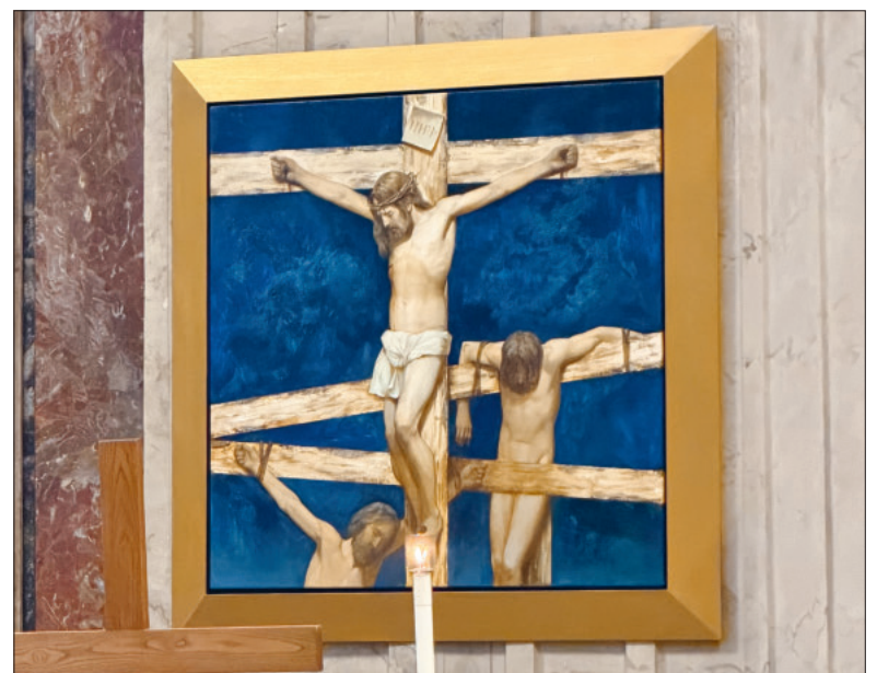
Die Darstellung Jesu war für den gläubigen Maler besonders herausfordernd.