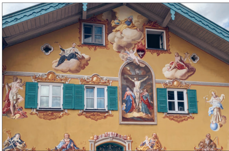
Jesu Kreuzigung. Lüftmalerei in Mittenwald (D).

Die Karwoche ist die heiligste Zeit im Kirchenjahr. Sie führt uns Schritt für Schritt durch das Leid und die Passion Jesu hin zur Freude der Auferstehung.