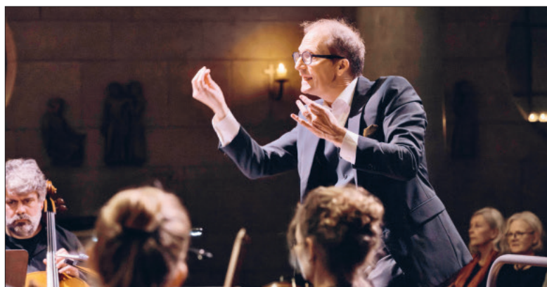
Weihnachtskonzert «I am Christmas» im MaiHof (2023).

«Die Ewigkeit ins Herz gelegt». Im Interview berichtet der Komponist Lorenz Ganz über die Entstehung dieser Kantate.