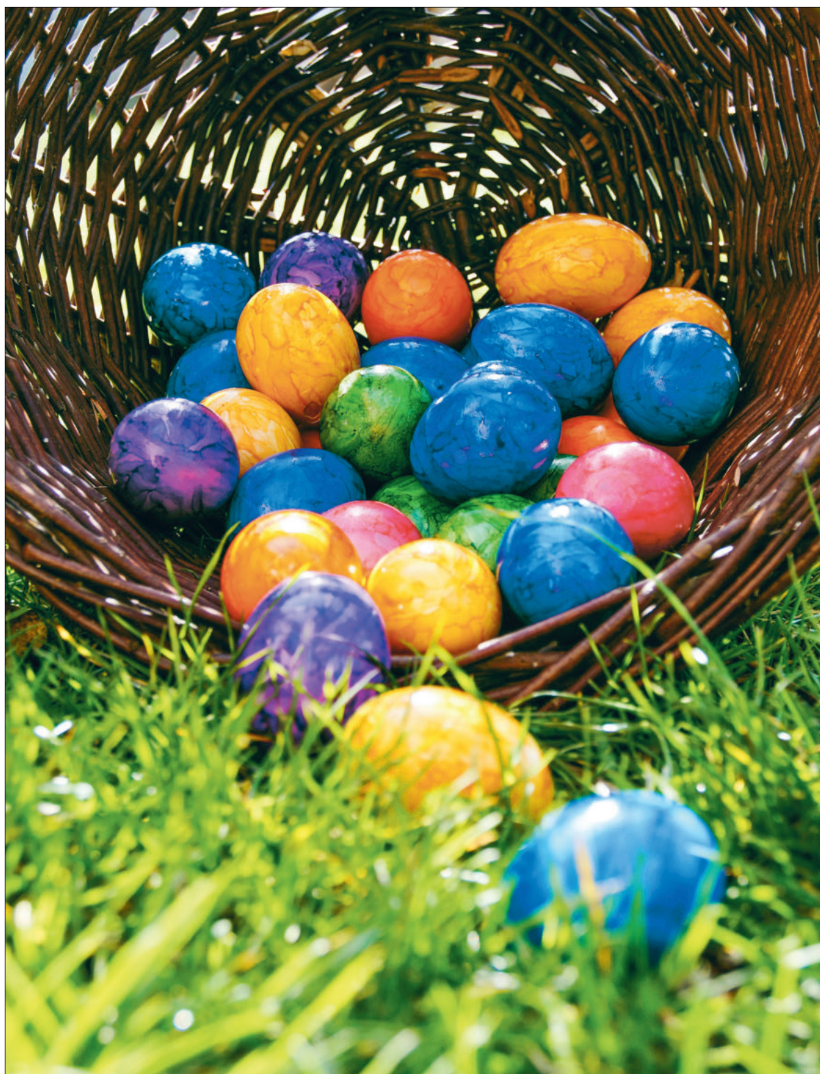
Vor Ostern werden wieder gekochte Eier gefärbt.

Nach knapp einem Vierteljahrhundert in der Kirche Luzern verlässt Pastoralraumleiter Thomas Lang die Pfarrei. Eine Würdigung durch den Kirchenrat. Seiten 6/7