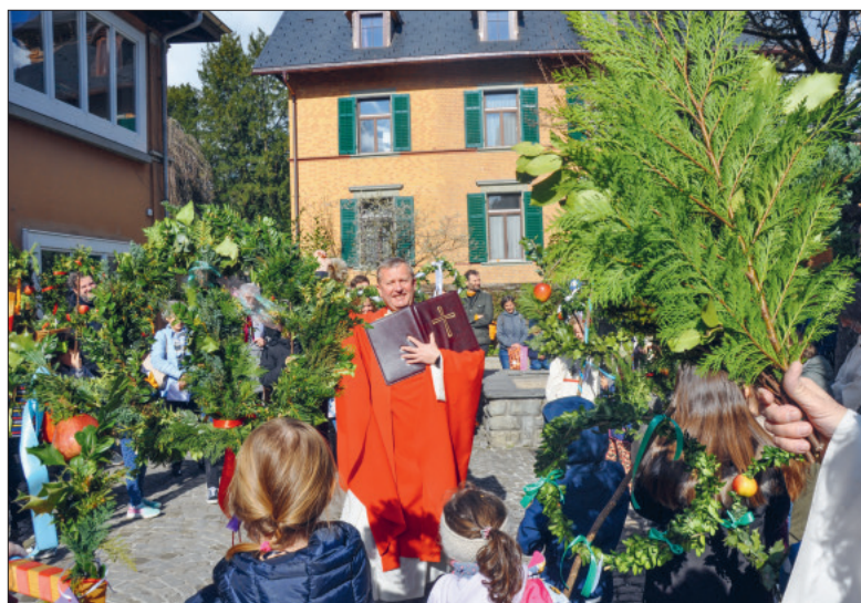
Der Palmsonntag als Einstieg in die Karwoche.

Die biblischen Texte von Karwoche und Ostern bergen eine grosse Kraft und können auch unser Leben verändern.