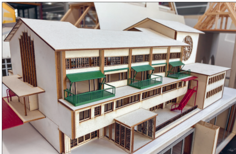
Das Modell einer Studentin von der umgenutzten Kirche St. Anton.