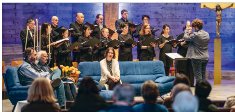
Der Opernchor des Luzerner Theaters und das Team Unerhört.

Am Samstag, 28. März, 10.30 Uhr, geht das neue Format «Unerhört – Oper trifft Theologie» in die zweite Runde.