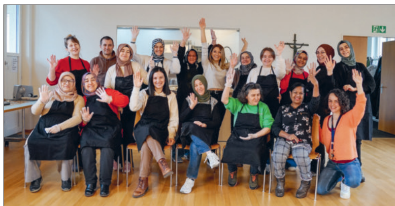
Unser fröhliches Brotchips-Backteam.

Dreimal pro Monat jeweils am Donnerstagmorgen duftet es bei uns herrlich würzig. Dann verwandelt sich unser Pfarrsaal in eine Brotchips-Bäckerei.