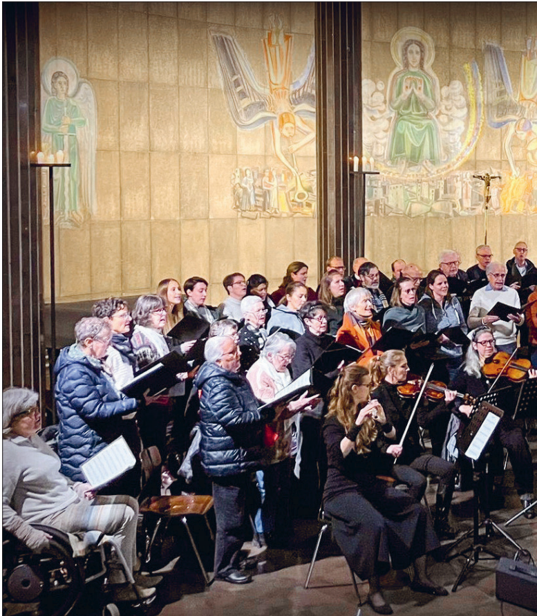
Der St. Karli Chor während eines Konzerts in der Kirche.