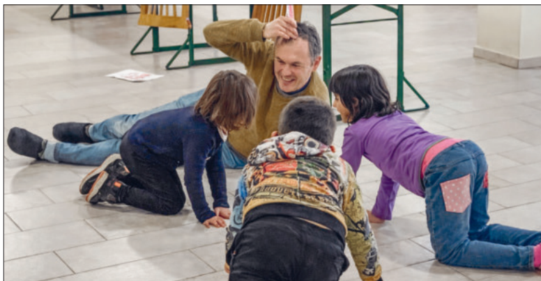
Ruhige Freude und echte Begeisterung im gemeinsamen Spiel.

La Casa di Leskoc, gegründet von der Caritas Umbrien, ist ein Haus, das im ehemaligen Kriegsgebiet für Frieden und Zuhause steht. Ein Kinderheim, das die Menschen der Umgebung unterstützt.