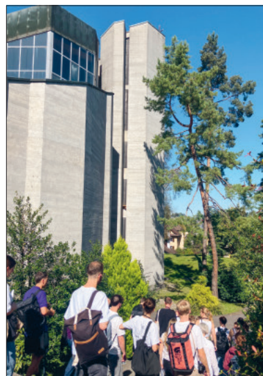
Studierende während der Begehung der Kirche St. Michael.

Aber warum sollte in einer Kirche gewohnt werden? Diese Ausgangslage ergab sich durch die allgemeinen Verhältnisse des knappen Wohnraums. Wohnen ist grundsätzlich positiv konnotiert und die Erweiterung des Wohnraumangebots wird auch politisch von allen Seiten gefordert. Überdies ist unsere Bausubstanz aus verschiedenen Epochen eine spannende Herausforderung für Architekturstudierende. Chris-