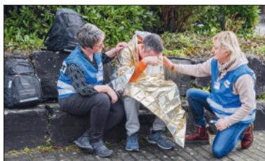
Care-Giver im Einsatz (gestellte Szene).

pd. Die Notfallseelsorgenden und Care-Giver waren 2025 bei 117 Ereignissen und während 985 Stunden im Kanton Luzern im Einsatz. Dies teilt die Ökumenische Notfallseelsorge mit. «Im Vergleich der letzten Jahre ist dies die mit Abstand höchste Zahl», sagt Christoph Beeler-Longobardi, Co-Leiter Ökumenische Notfallseelsorge/Care-Team Kanton Luzern. 2024 standen die Teammitglieder bei 97 Ereignissen im Einsatz und leisteten 980 Stunden an psychologischer und seelsorgerlicher Unterstützung. Notfallseelsorgende und Care-Giver sind bei Suizid, aussergewöhnlichen Todesfällen oder schweren Verkehrsunfällen im Einsatz. Sie werden vom Rettungsdienst 144, von der Polizei oder der Feuerwehr aufgeboten.