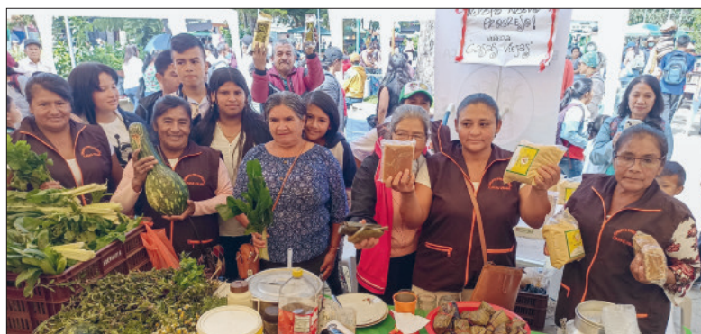
Kolumbianische Frauen vom Verein Atucsara mit ihren Produkten.

Wer Kirchensteuern bezahlt, unterstützt soziale und karitative Anliegen vor Ort und sichert Arbeitsplätze. Schon bei Jesus spielte Geld eine Rolle.