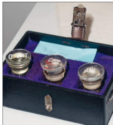
Ein Lederköfferchen für den sicheren Transport der Öle.

Die Sakristan:innen, die an diesem Tag aus Weggis, Adligenswil, Horw, Kriens, Littau und Rothenburg eintreffen, haben spezielle Gefässe dabei, um die Öle abzufüllen und in ihre Pfarreien zu transportieren. Viele kommen mit drei gläsernen Fläschchen, die sich in einem ledernen Köfferchen befinden. Andere haben silber- oder goldfarbene kleine Döschen dabei. Es fällt auf, mit welcher Sorgfalt die Sakristan:innen die Gefässe be-